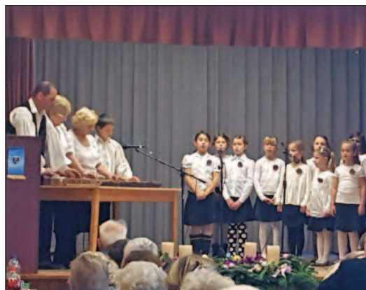
Citerazenekar és a Mákvirágok