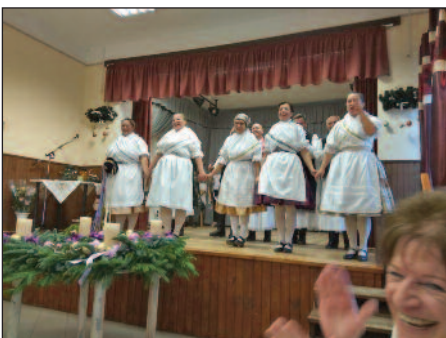
Keringészavar Néptánc Csoport